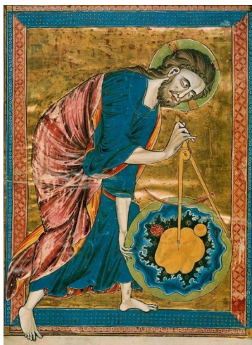
Miniatyr över "Gud som världens arkitekt" från en bildbibel skapad i Paris c:a 1220–1230. Bläck, tempera och bladguld på veläng.

Vilken kunskap kan vi ha om det Vad betyder det för vår den mänskliga tillvaron och kristna tron att säga om det? Vi en kristen tro och ett kristet liv akademisk verksamhet och gärning. Genom föredrag, gemenskap får vi tillsammans känna varandra bättre, knyta erfarenheter av vad det är att akademien. Öppet för akademi, t. ex. forskare, administratörer. Internatet har inriktning, och genomförs